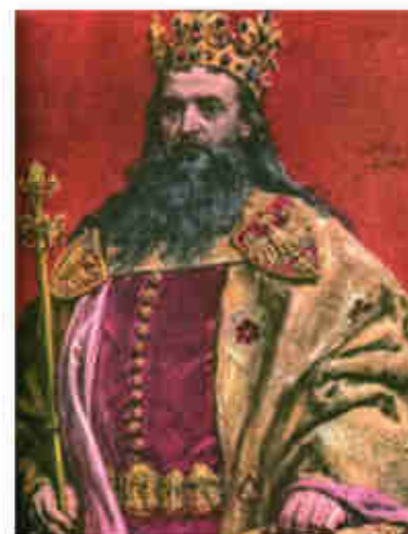
Kazimierz Wielki (* 1310 † 1370) był czterokrotnie żonaty. Miał kilka córek, nie doczekał się jednak syna. Dlatego był ostatnim królem Polski z dynastii Piastów.

Następcą Władysława Łokietka został jego jedyny syn Kazimierz , nazwany później przez potomnych Wielkim . Nowy władca został koronowany w 1333 roku . Państwo, które odziedziczył Kazimierz, znajdowało się w trudnym położeniu. Król czeski – Jan Luksemburski – jako dziedzic Wacława II uważał się za następcę polskiego tronu i panował nad Śląskiem. Od północy zagrażali Polsce Krzyżacy, którzy nie zamierzali rezygnować z zagarniętego Pomorza Gdańskiego. Wroga Polsce była też sąsiadująca z nią od zachodu Brandenburgia. Przyjazne stosunki państwo polskie utrzymywało tylko z Węgrami. Sojusz z tym krajem umacniał fakt, że siostra Kazimierza była żoną króla węgierskiego.